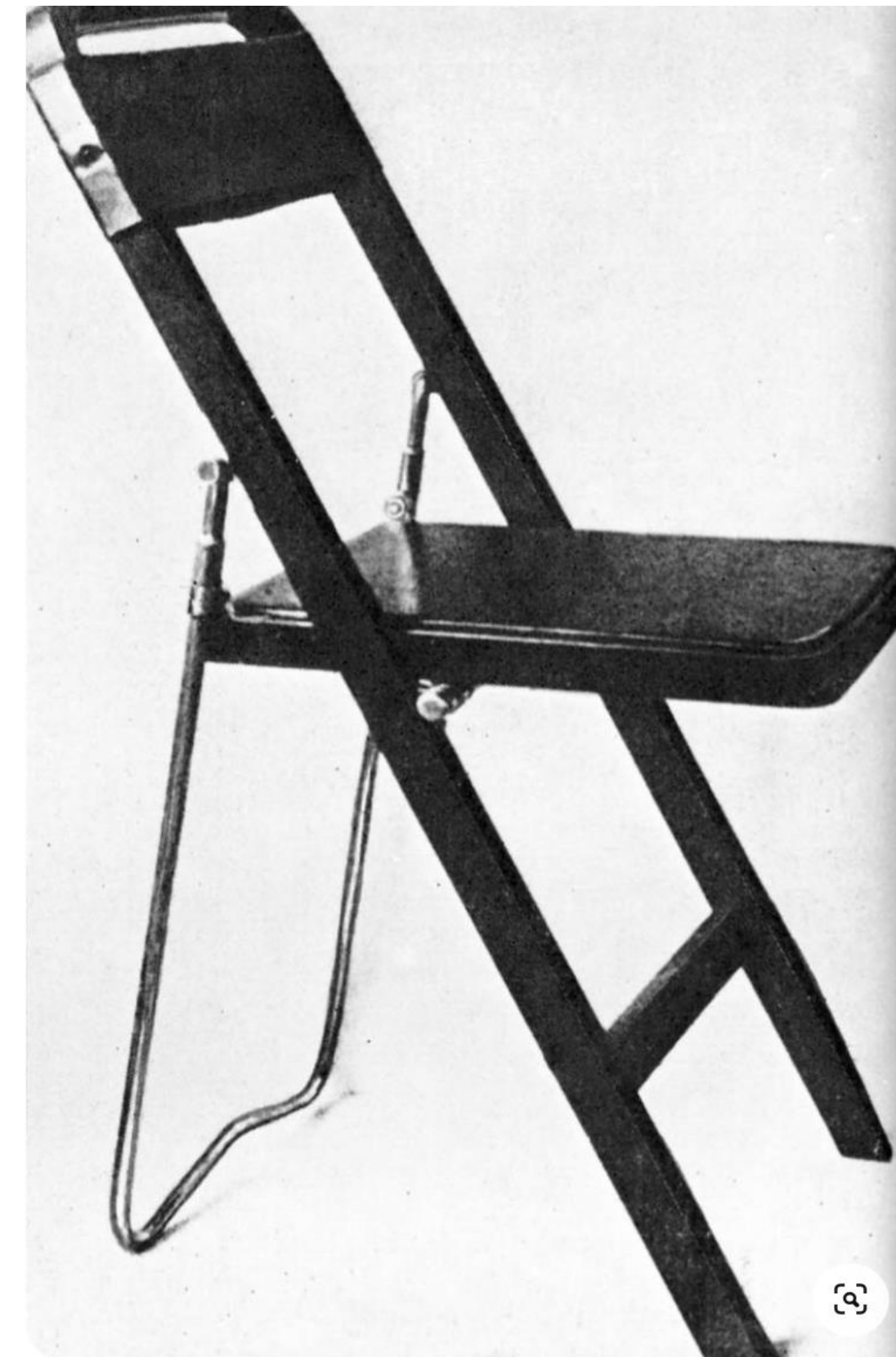
ВХУТЕМАС. Складной стул Земляницына