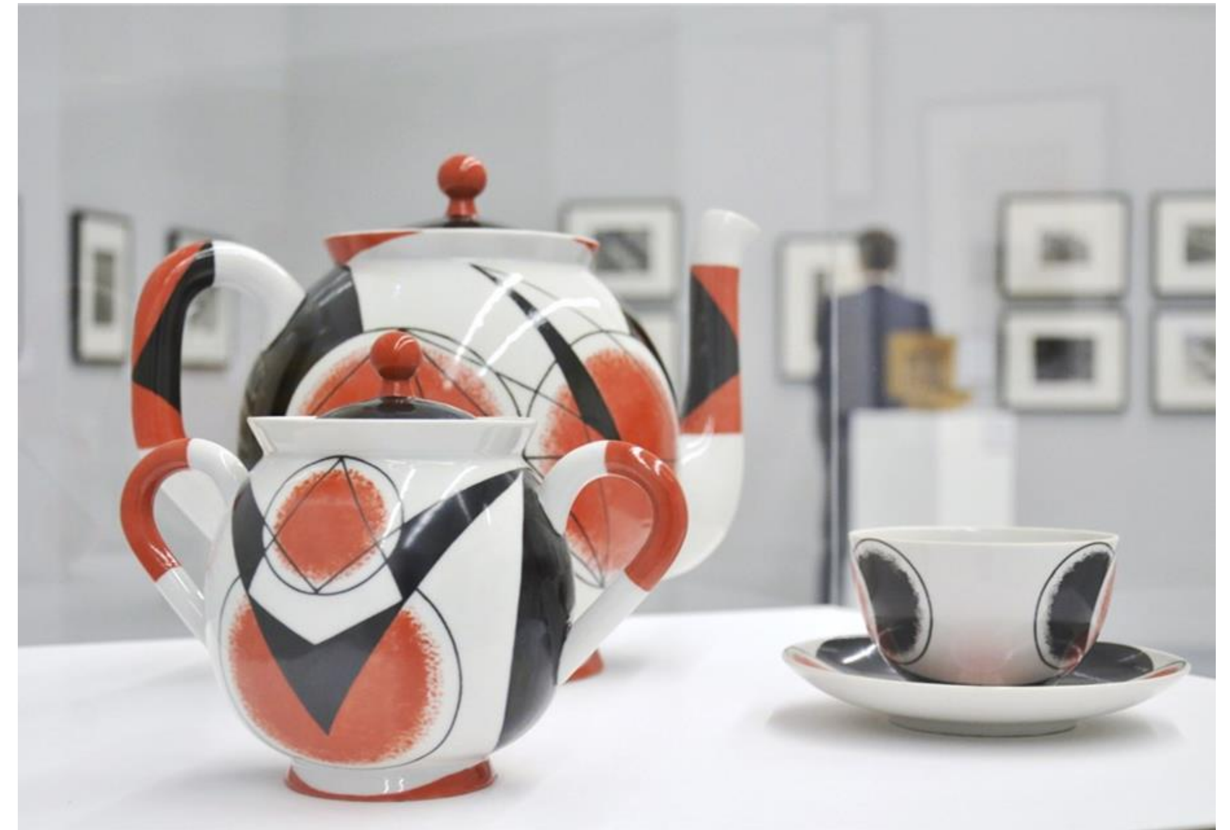
Чайный сервиз по эскизу А. Родченко. 1922 г.