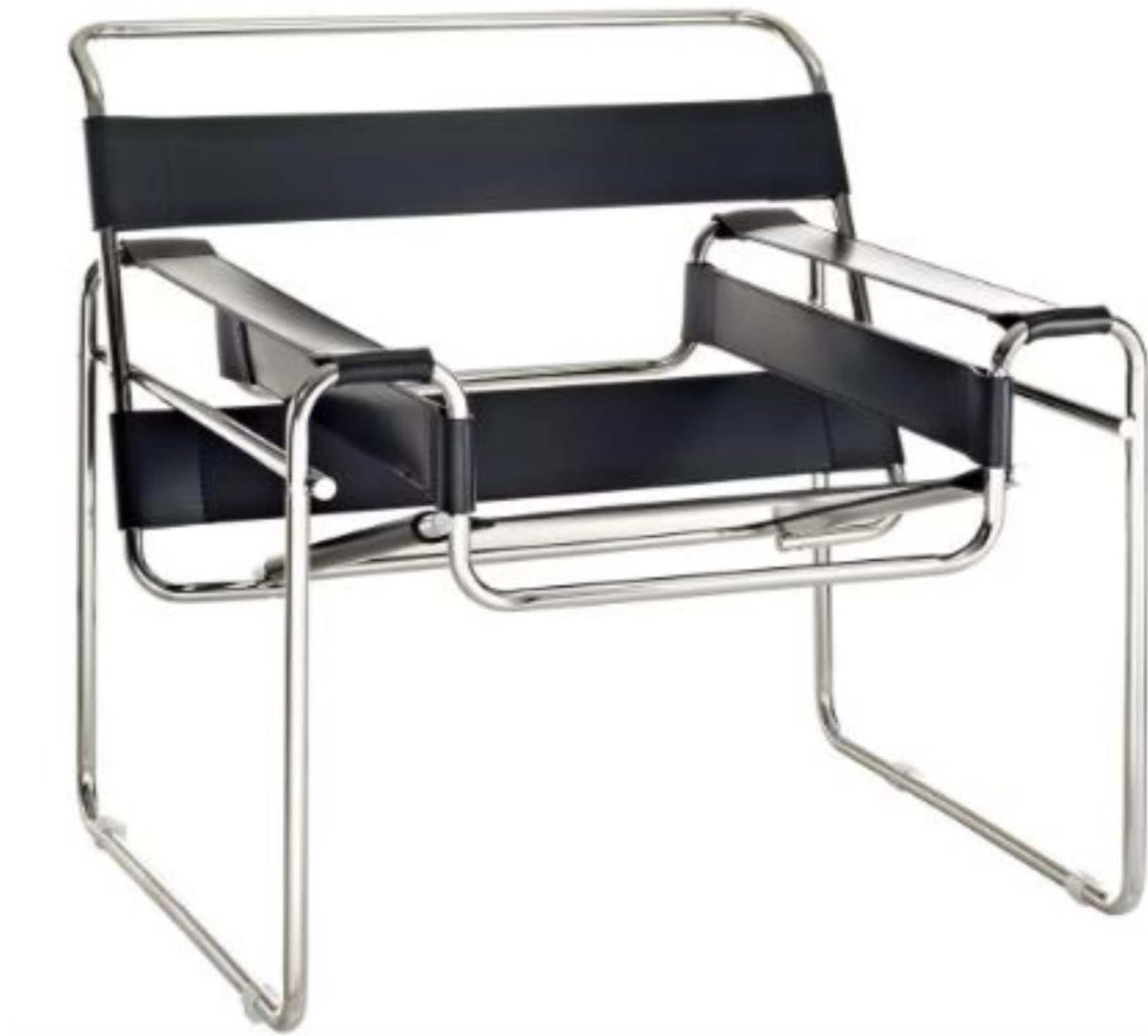
Bauhaus. Кресло Василия, также известное как кресло модели В3, было разработано Марселем Брейером в 1925-1926 годах