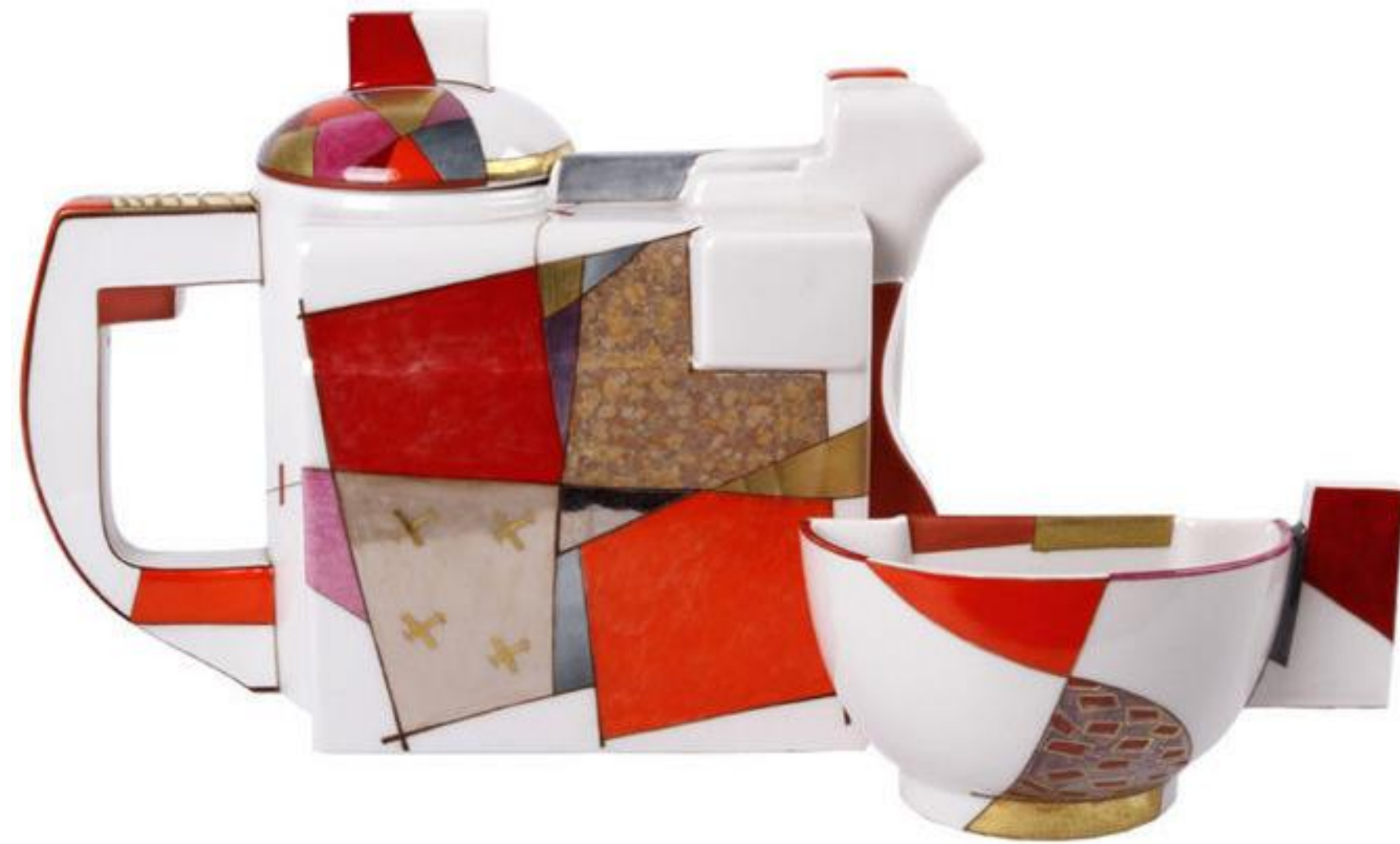
Супрематический чайник и чашки-половинки по эскизу К. Малевича для фарфорового завода. 1923 г.